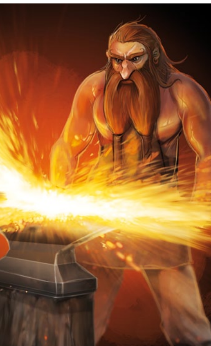
Scardil, le forgeron

Pour leurs caractéristiques, reportez-vous à la page 212 du LdB d'Anoë, le Garde du Corps expérimenté pour Conrad et le Garde du Corps très expérimenté pour Vrillis.